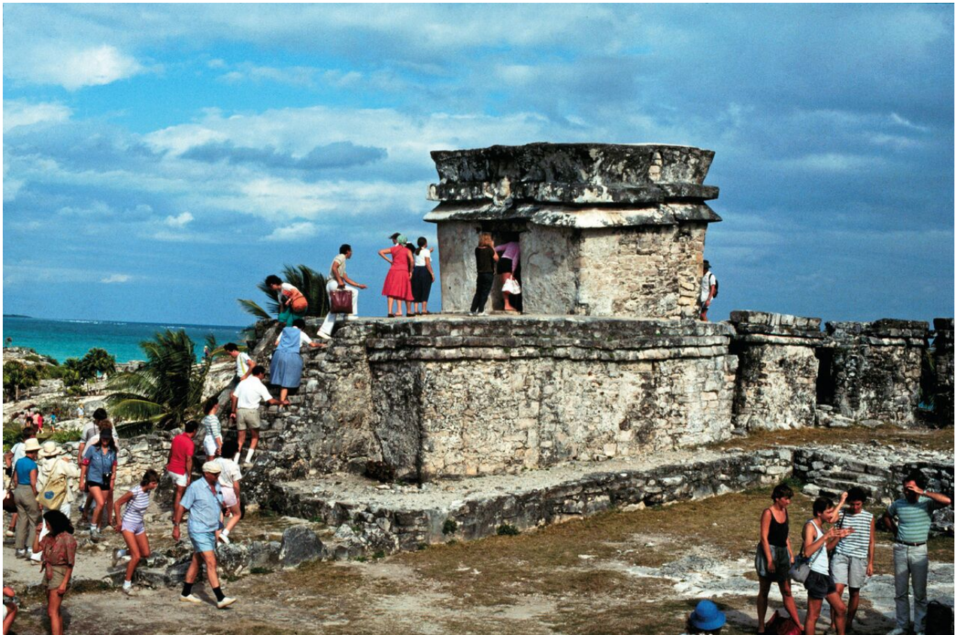
Leandro Katz. Temple of the Descending God – Tulum

Se trata de un repaso a sus cuatro décadas de trayectoria a través de ocho series de imágenes y trece piezas audiovisuales, entre ellas filmes experimentales de los setenta y ochenta, películas documentales y textos.