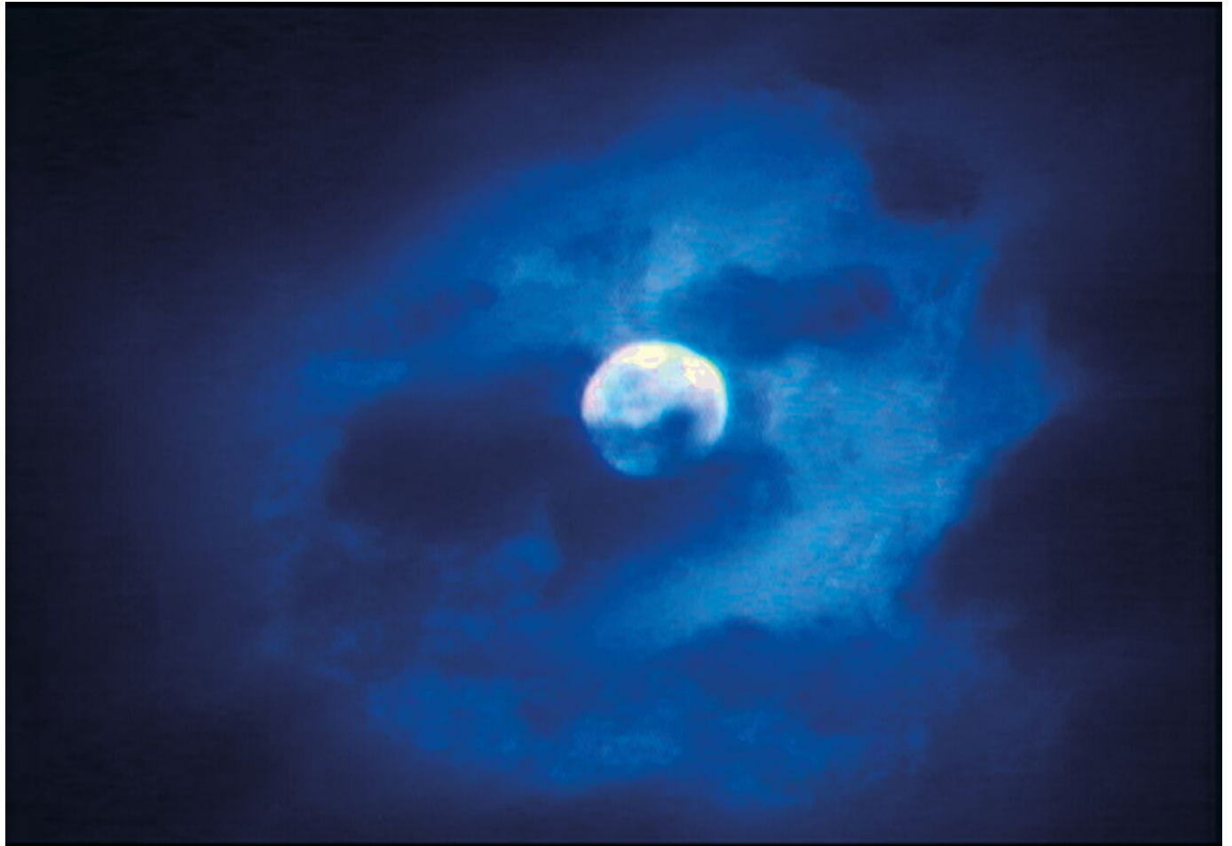
Leandro Katz. Notas de luna

Del mismo modo que Katz no observa facturas entre lo presente y lo pasado, tampoco las encuentra, ni le interesa marcarlas, entre sus obras terminadas y el proceso, frecuentemente experimental, que las ha originado. Curiosamente uno de sus filmes más atrevidos fue precisamente el primero, llevado a cabo en 1972: Estación Los Ángeles . Combinando imagen fija e imagen en movimiento, retrató con absoluta simplicidad y belleza a la población residente junto a las vías del tren en Quiriguá (Guatemala). El resultado era tan vanguardista como sencillo: se rodó en una única toma combinando el mismo número de planos fijos y en movimiento.